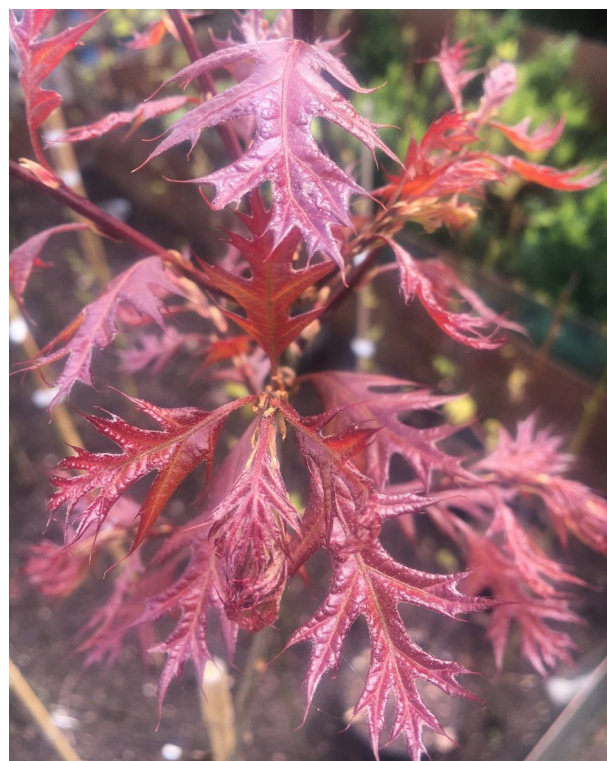
Q. texana New Madrid